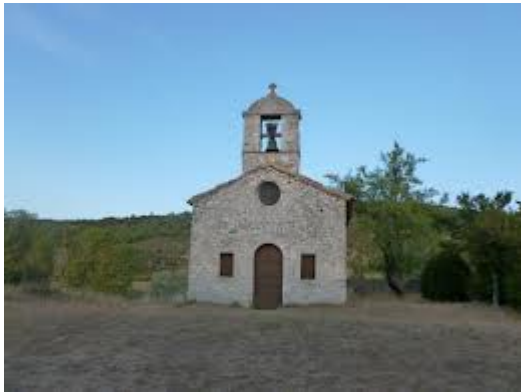
Chapelle Sainte Foy, Méthamis